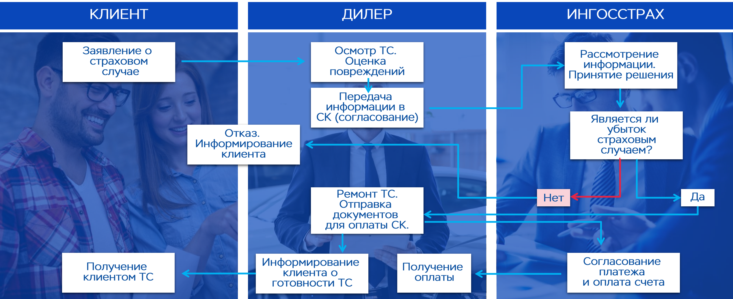
Схема урегулирования страховых случаев